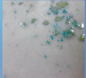
TÂCHES BLEUES (CRACK)

DANS LE CAS D'UNE RÉACTION POSITIVE, SOUMETTRE LA PREUVE À UNE ANALYSE ULTÉRIEURE DANS UN LABORATOIRE SELON LE PROTOCOLE DE VOTRE AGENCE