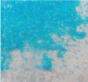
BLEU FONCÉ (COCAÏNE HCL)